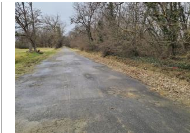
marque sur Végétation