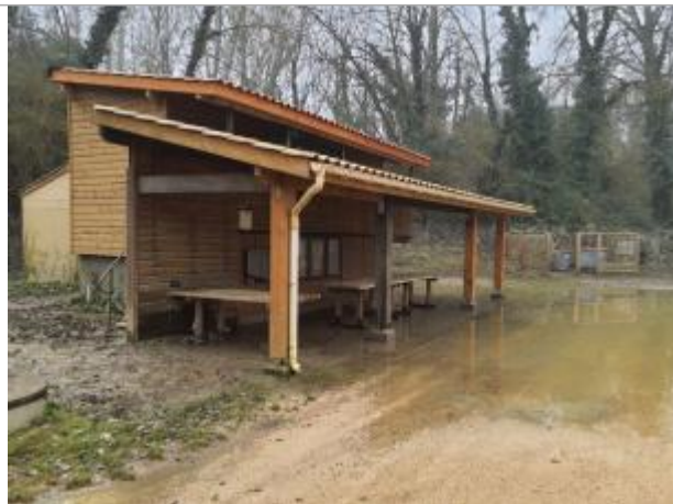
marque sur structure