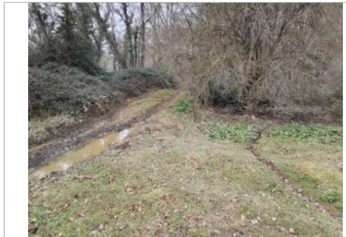
Marque sur végétaux

Coordonnées WGS84 : X: 1.40184340 / Y: 43.66316170