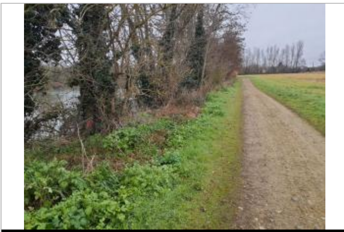
Traces sur végétaux

GÉOLOCALISATION Coordonnées WGS84 : X: 1.40724190 / Y: 43.65938820 Coordonnées RGF93 (Lambert 93) X: 571496.17 / Y: 6285779.17 Coordonnées RGF93 (ETRS89) : X: 1.4072419 / Y: 43.6593882 Code Hydro: O--0000 Rive de référence: Droite