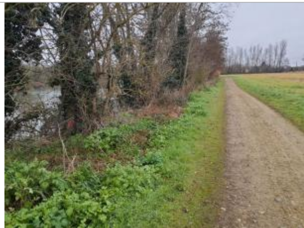
Traces sur végétaux