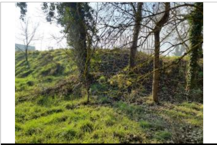
Trace sur Végétation

GÉOLOCALISATION Coordonnées WGS84 : X: 1.40342680 / Y: 43.65552790 Coordonnées RGF93 (Lambert 93) X: 571179.74 / Y: 6285356.46 Coordonnées RGF93 (ETRS89) : X: 1.4034268 / Y: 43.6555279 Code Hydro: O--0000 Rive de référence: Gauche