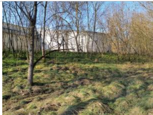
marque sur végétaux