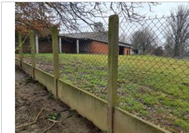
marque sur structure

Coordonnées WGS84 : X: 1.40858490 / Y: 43.65416120