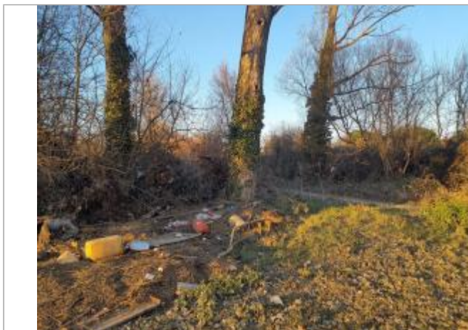
Trace sur Végétation

Coordonnées WGS84 : X: 1.40862480 / Y: 43.65248220