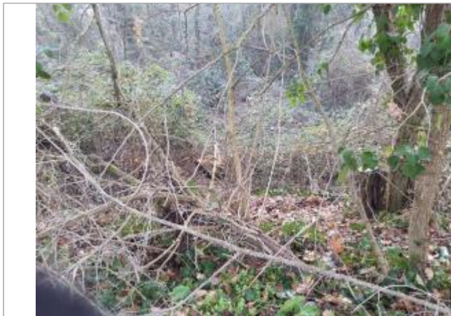
marque sur végétaux