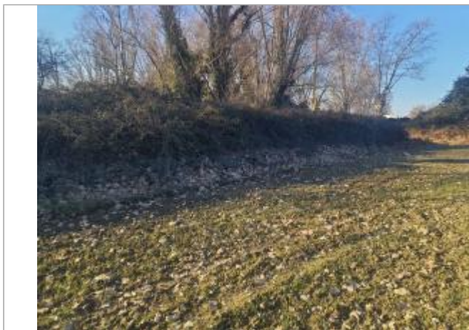
Marque sur végétaux

Coordonnées WGS84 : X: 1.41001750 / Y: 43.64595140