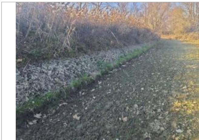
Marque sur végétaux

Coordonnées WGS84 : X: 1.41039130 / Y: 43.64495710