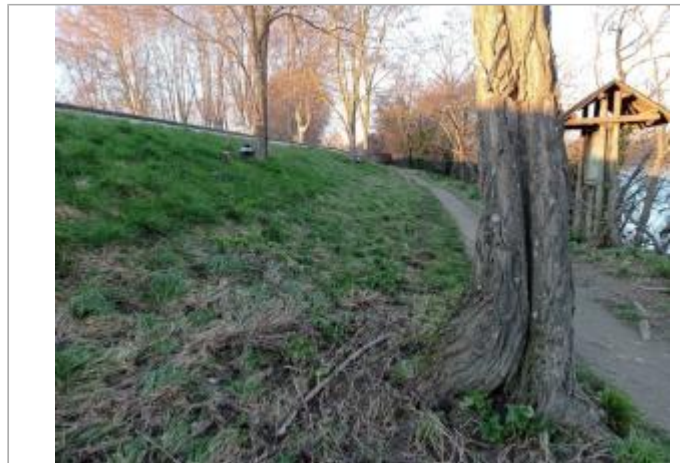
Débris végétaux

Coordonnées WGS84 : X: 1.40237670 / Y: 43.63419340