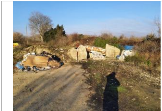
Marque sur structure

Coordonnées WGS84 : X: 1.40656020 / Y: 43.63381060