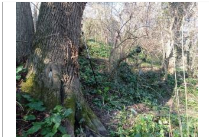
Débris végétaux