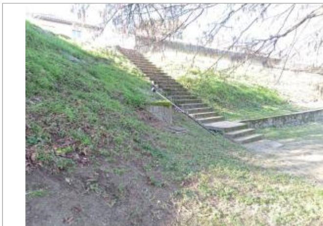
marque sur végétaux