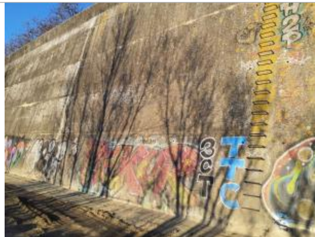
Marque sur structure