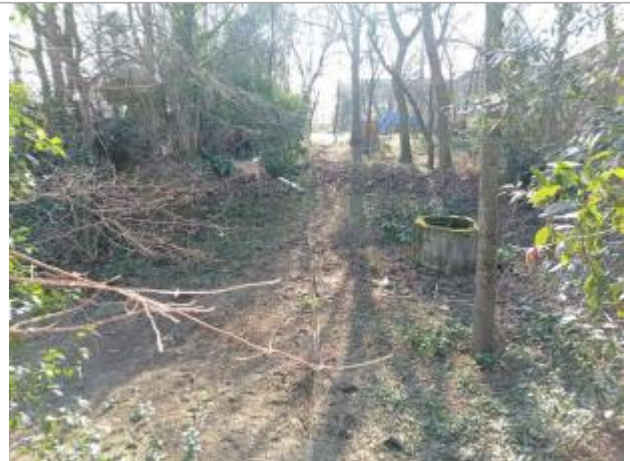
Débris de végétaux

Coordonnées WGS84 : X: 1.40481880 / Y: 43.61325650