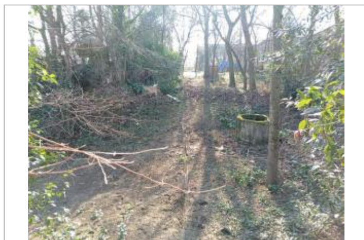
Débris de végétaux

GÉOLOCALISATION Coordonnées WGS84 : X: 1.40481880 / Y: 43.61325650 Coordonnées RGF93 (Lambert 93) X: 571197.14 / Y: 6280657.2 Coordonnées RGF93 (ETRS89) : X: 1.4048188 / Y: 43.6132565 Code Hydro: O--0000 Rive de référence: Gauche