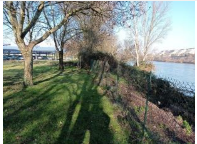
Débris de végétaux

Coordonnées WGS84 : X: 1.40576710 / Y: 43.61243660