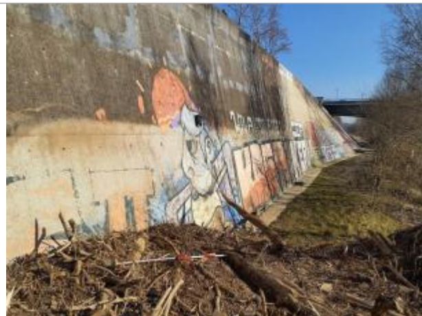
marque sur digue