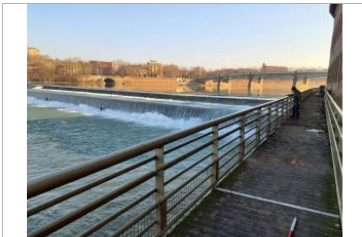
Marque au sol