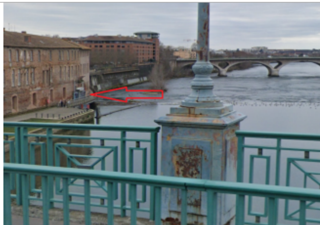
Vue du site depuis le pont Saint-Pierre

Coordonnées WGS84 : X: 1.43249310 / Y: 43.60165420