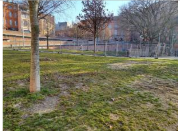
Débris végétaux

Coordonnées WGS84 : X: 1.43873330 / Y: 43.60154440