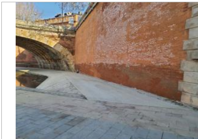
Marque sur structure

Coordonnées WGS84 : X: 1.44028140 / Y: 43.59914000