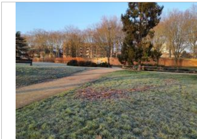
Débris végétaux

Coordonnées WGS84 : X: 1.43730290 / Y: 43.59609430