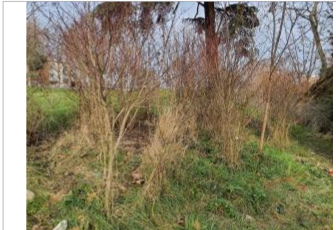
Sol Débris végétaux

Coordonnées WGS84 : X: 1.44048410 / Y: 43.59122570