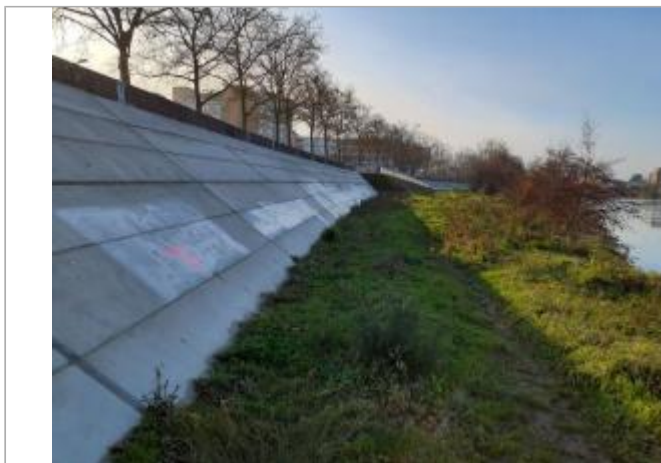
Marque sur digue