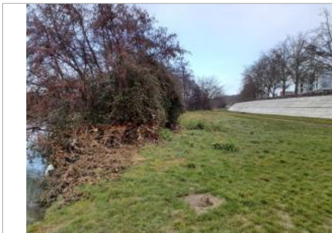
Débris végétaux sur haie