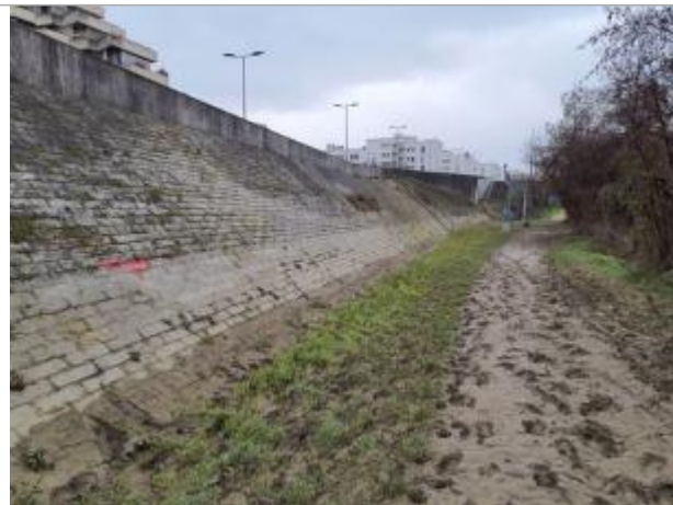
Marque sur digue