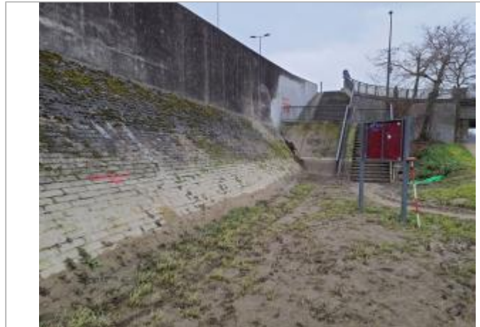
Marque sur digue

Coordonnées WGS84 : X: 1.43940770 / Y: 43.58454580