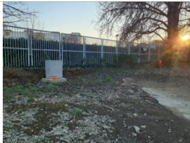
débris sur massif béton