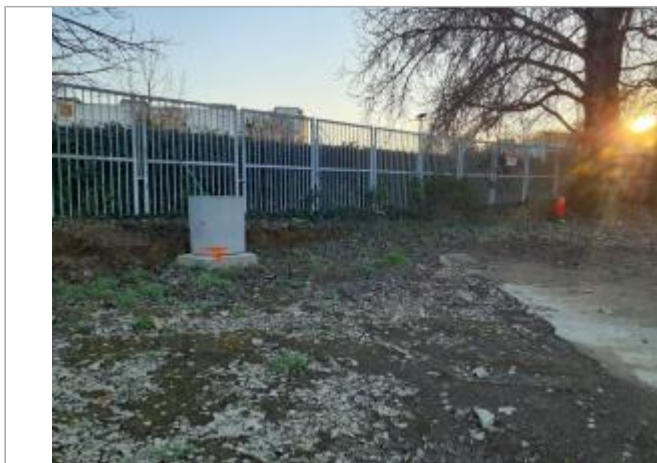
débris sur massif béton