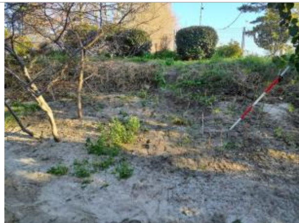
marque sur Végétation