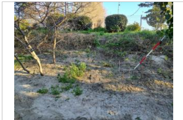
marque sur Végétation

GÉOLOCALISATION Coordonnées WGS84 : X: 1.43204080 / Y: 43.58611790 Coordonnées RGF93 (Lambert 93) X: 573335 / Y: 6277597.58 Coordonnées RGF93 (ETRS89) : X: 1.4320408 / Y: 43.5861179 Code Hydro: O---0000 Rive de référence: Droite