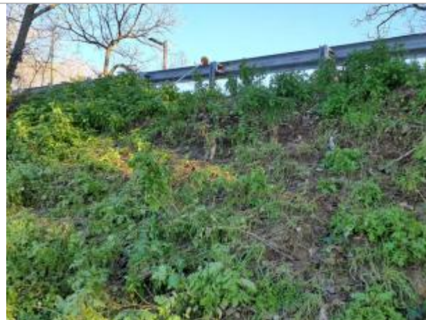
Marque sur Végétation

Coordonnées WGS84 : X: 1.43144180 / Y: 43.58547420