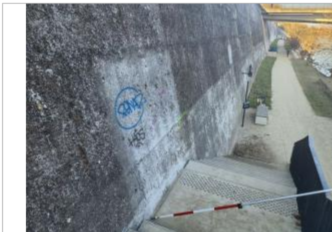
Marque sur structure proche À berge