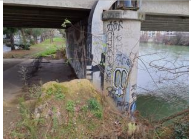
Marque sur pont

Coordonnées WGS84 : X: 1.43819770 / Y: 43.58404150