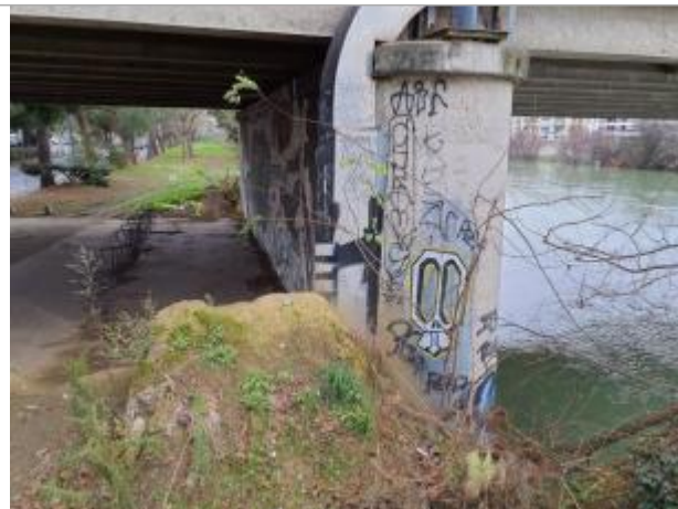
Marque sur pont