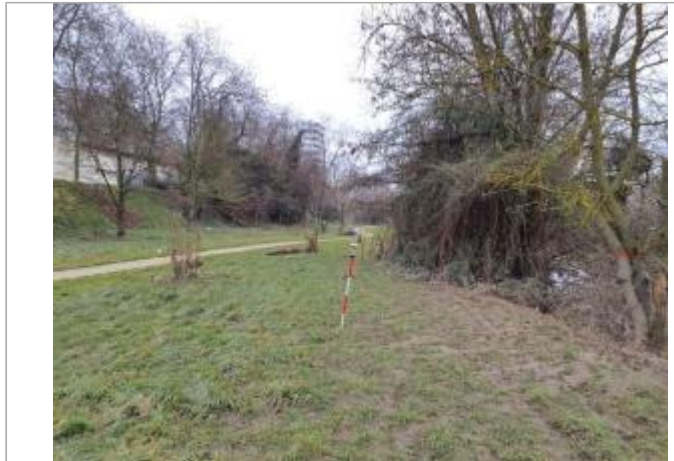
Marque sur Végétation

Coordonnées WGS84 : X: 1.43825220 / Y: 43.58192040