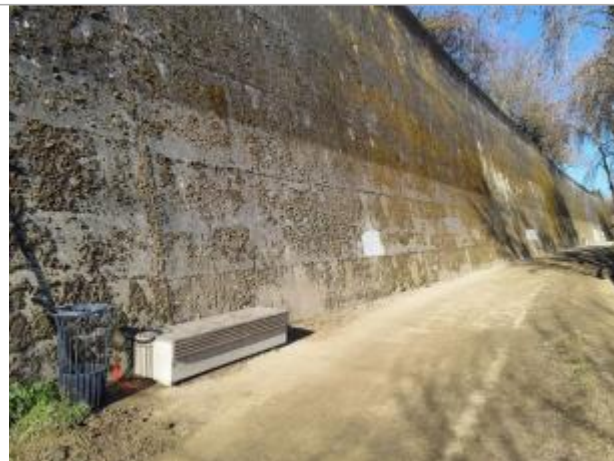
Marque sur structure

Coordonnées WGS84 : X: 1.42755890 / Y: 43.57738840