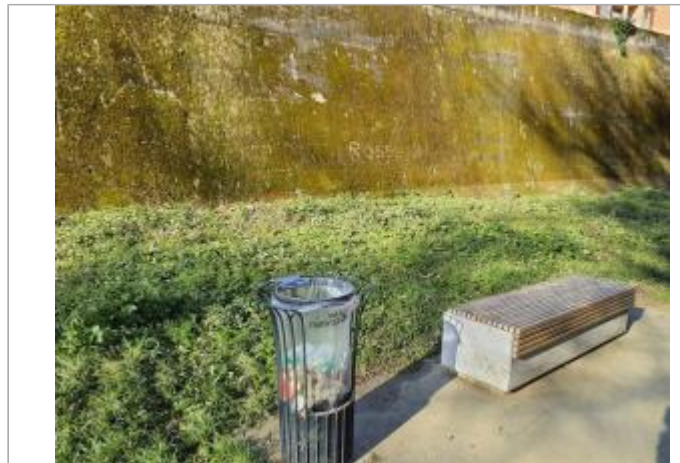
Marque sur structure

Coordonnées WGS84 : X: 1.42755200 / Y: 43.57597490