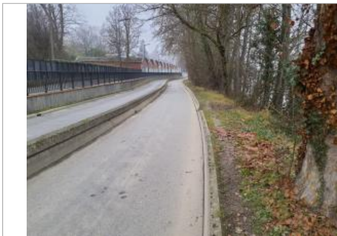
Sol debris vegetaux

Coordonnées WGS84 : X: 1.43462560 / Y: 43.57522970