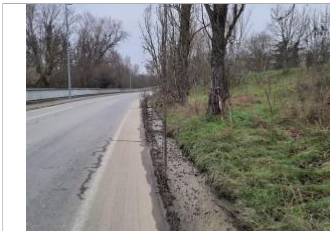
Sol debris vegetaux

Coordonnées WGS84 : X: 1.43642420 / Y: 43.57456740