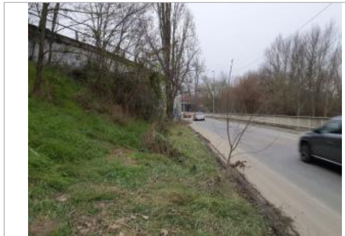
Sol debris vegetaux

Coordonnées WGS84 : X: 1.43674070 / Y: 43.57400720