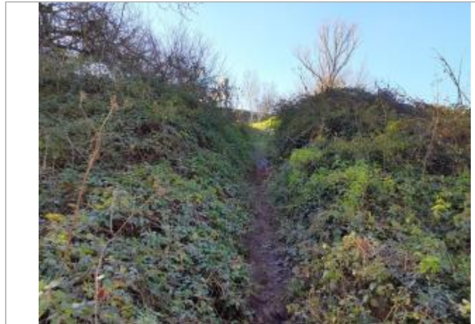
Débris végétaux au sol

Coordonnées WGS84 : X: 1.42956500 / Y: 43.57112840