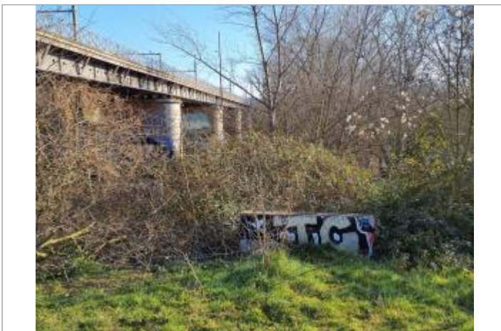
Présence d'eau dans structure

GÉOLOCALISATION Coordonnées WGS84 : X: 1.43017220 / Y: 43.56979210 Coordonnées RGF93 (Lambert 93) X: 573148 / Y: 6275786.45 Coordonnées RGF93 (ETRS89) : X: 1.4301722 / Y: 43.5697921 Code Hydro: O--0000 Rive de référence: Gauche