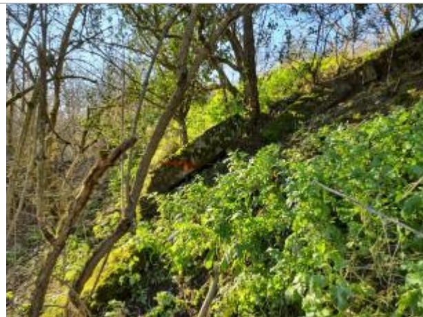
Marque sur sur les pierres