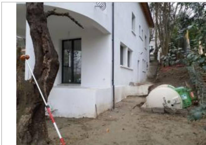
Marque sur bâtiment