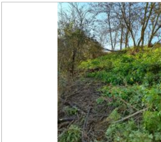
Sol debris vegetaux

Coordonnées WGS84 : X: 1.43111290 / Y: 43.56675000