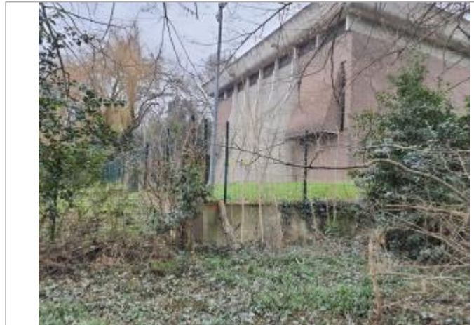
Marque sur mur