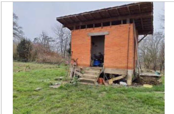
Marque sur bâtiment