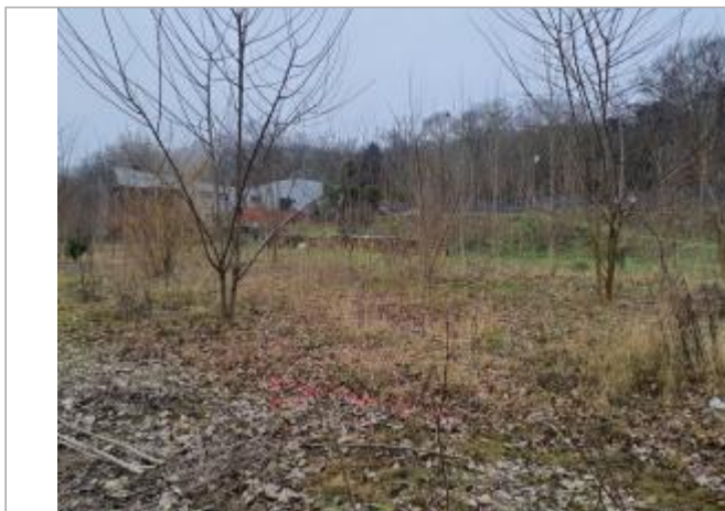
Sol debris vegetaux

Coordonnées WGS84 : X: 1.43874990 / Y: 43.56359510