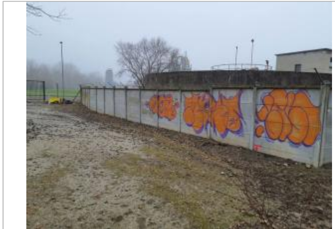
Marque sur mur

Coordonnées WGS84 : X: 1.43708990 / Y: 43.56175490