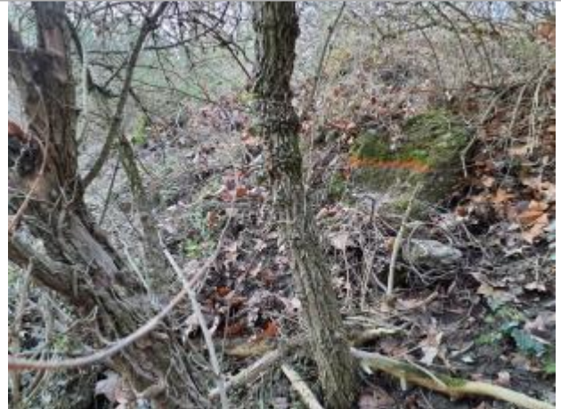
Marque sur sur les pierres

Coordonnées WGS84 : X: 1.43215990 / Y: 43.56169950